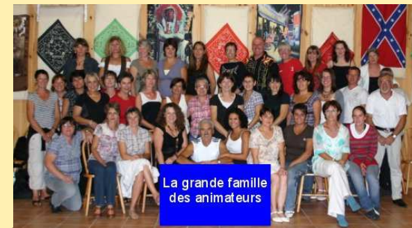
La grande famille des animateurs